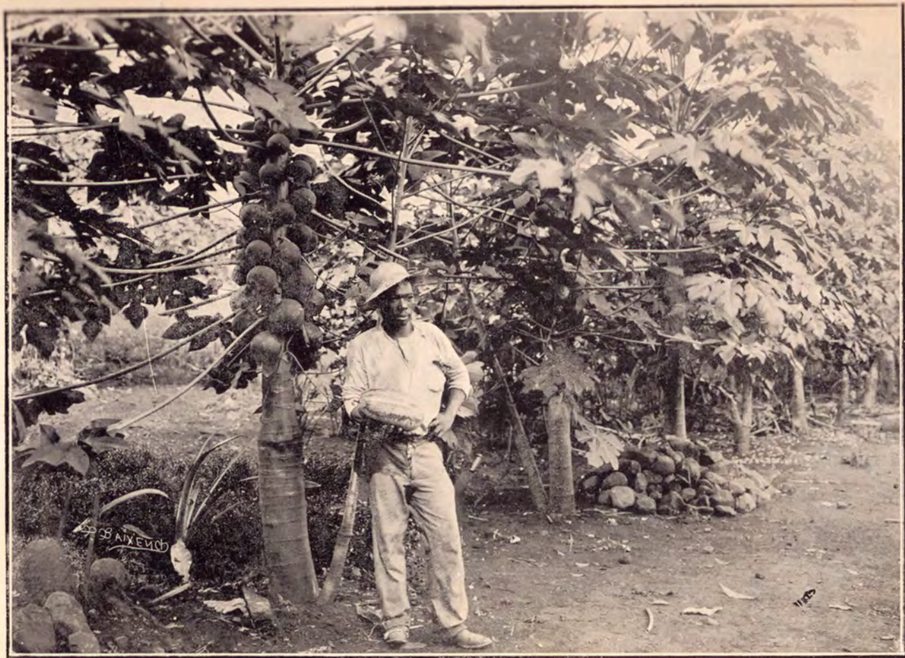
PAPAYA CULTIVADA EN COSTA RICA